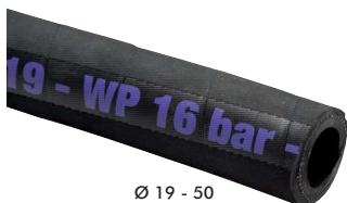
Ø 19 - 50